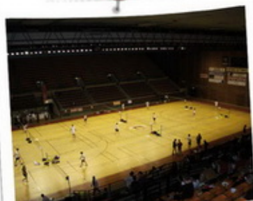
Palais Omnisports Lauga Bayonne