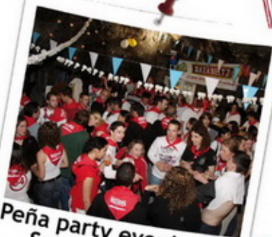
Peña party evening on Saturday night !