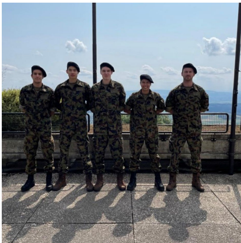
Athlet:innen des Nationalkaders während der Spitzensport-RS 2020

Schliesslich sind Athletinnen und Athleten, die die Spitzensport-RS bereits absolviert haben, bereit, allfällige Fragen zu beantworten und ihre persönlichen Erfahrungen in diesem Spezialprogramm der Schweizer Armee zu teilen.